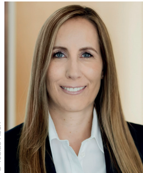
Astrid Wallmann Präsidentin des Hessischen Landtages

am 8. Oktober 2023 wählen die Bürgerinnen und Bürger in Hessen einen neuen Landtag. Die anstehende Wahl bietet die Gelegenheit, den jungen Menschen unseres