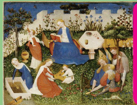
Paradiesgärtlein, Oberrheinischer Meister, ca. 1410/1420, Städel Museum, Frankfurt a.M.

Die Klima-Ag des Lessing-Gymnasiums informiert zu Klimafragen